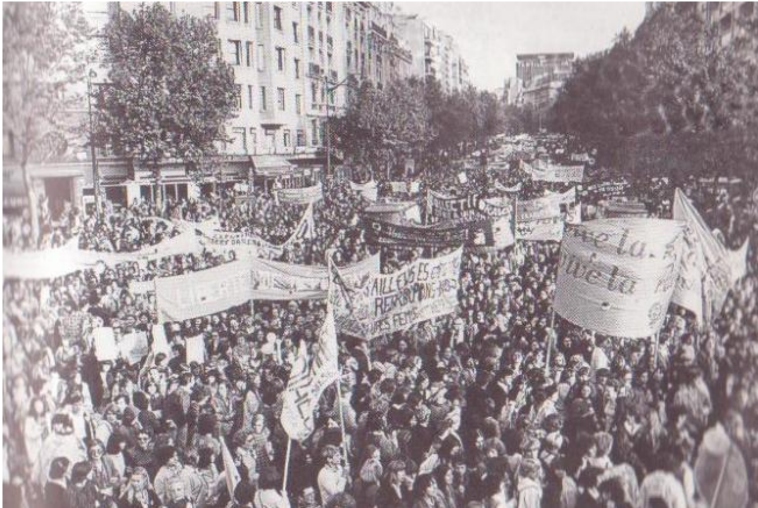
Marche nationale pour l'avortement 1979